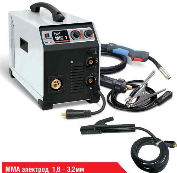
MMA электрод 1,6 – 3,2мм

Профессиональный инверторный сварочный аппарат класса «А» промышленного назначения для полуавтоматической сварки в среде защитного газа (MIG/MAG) и сварки стали и чугуна электродами с покрытием (MMA). Аппарат управляется простым поворотным регулятором с настройкой сварочного тока в диапазоне от 10 до 200 А. Отличается малыми размерами и небольшим весом.